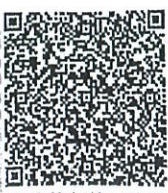
曹政的年检二维码