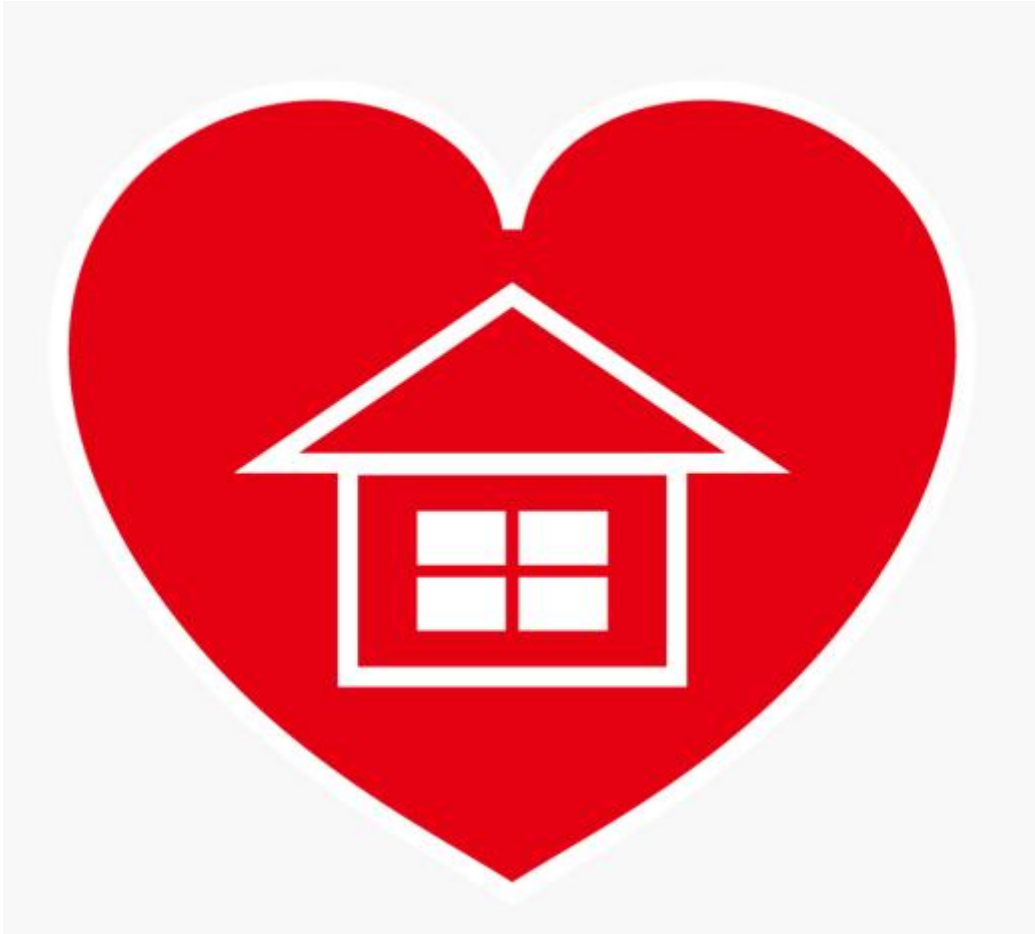
图 B.1 标志牌图标样式示意图